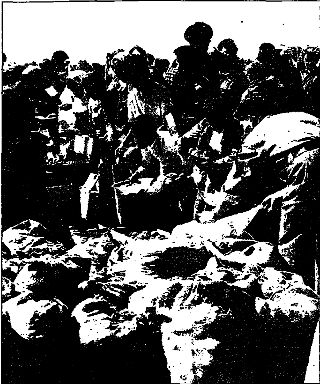
توزيع الأغذية على اللاجئين في مخيم البقعة

هذه أسئلة تتفرع عن سؤال واحد؛ ما هو المخيم؟ وهل الأجوبة تنبع من السؤال نفسه أو من الأسئلة التي تتفرع عنه. ففي ظني أن المخيم تخير غير اللسان كما تخير دوره وتضيق الأمدال التي وجد من أجابها، وبالتالي تخير قاطنوه، تخيرت قاعاتهم، تخيرت أهدافهم، تخيرت أسباب وجودهم، تخير كل شيء فيهم حين تغيرت أحلامهم وأمانيتهم وأملهم، بما يعني أنهم انسلخوا عن المكان وما يرمز إليه وعليه فإن لفظة مخيم لم تعد أكثر من مصطلح يدل على حالة أو وضعية كانت حين نشأ أول مخيم عام التكية الأولي، حين كان المخيم مجموعة خيام فأخذ اسمه منها وقلل موسوماً بها، حتى بعد أن زالت الخيام لتحل محلها غرف الطين والقصب، وإن كانت هذه أبنية عم الخيام فليس هناك قرية تكبر ما بين الخيام بيوت السمات المسلح وواجهات الحجر التي بدأت تتخذ طوبق بعد عام 1967. وبعد قاطنوها على العمل أن تقود تاطعات سحب بعد أن علنا لاقطت البث التلفزيوني واطبقوا للقرار الصناعي وتقدمت السيارات القارية تضيء مصابيحها مع مصابيح التلوث ليل المخيم بعد ما أطفأ قاطنوه والى الأبد السراج التي كانت تحيط الأبنية على نوره الكافي ليلاهم بالتحضير والعودة، ويشعل الأبناء غلايبهم